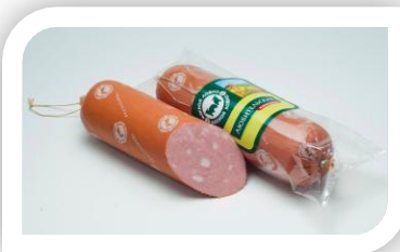
МЛ№1 Любительская б/о газ/у