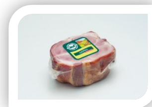
МЛ№1 Шейка к/в в/у кусок