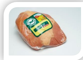
МЛ№1 Окорок к/в в/у кусок