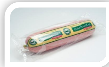
МЛ№1 Любительская ц/о газ/у