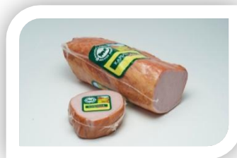
МЛ№1 Карбонад-Б к/в в/у