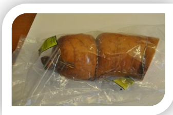
МЛ№1 Любительская в синюге газ/у 1/2 батона